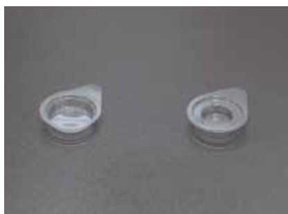
ティシュー・テック クリオモールド(丸型) スタンダード：25mmφ バイオプシー：15mmφ