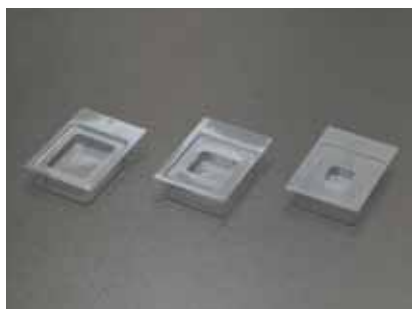
ティシュー・テック クリオモールド(角型) 1号：10×10×5mm 2号：15×15×5mm 3号：25×20×5mm