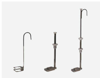
ヒスト・テック 冷却用具シリーズ