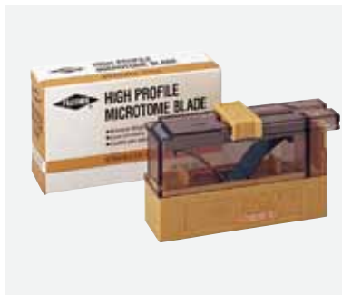
フェザー クリオスタット用替刃 ハイプロファイル

一般的名称：単回使用マイクローム用刃 医療機器分類：一般医療機器 製造販売届出番号：21B2X10001071002 製造販売業者：フェザー安全剃刀株式会社 岐阜県美濃市松森 600-1