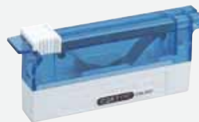
フェザー クリオスタット用替刃 C35

一般的名称：単回使用マイクローム用刃 医療機器分類：一般医療機器 製造販売届出番号：21B2X10001071002 製造販売業者：フェザー安全剃刀株式会社 岐阜県美濃市松森 600-1