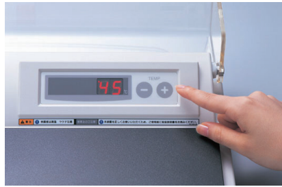
操作パネルによる温度設定